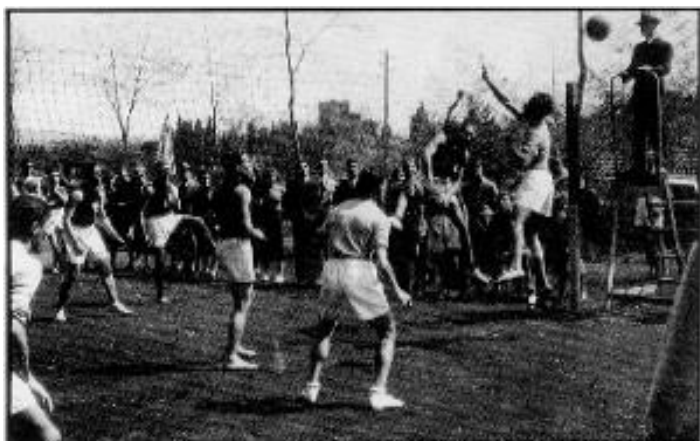
Roma 1948: I Campeonato da Europa

O primeiro Campeonato Nacional de Seniores Masculino disputou-se em 1946/47, tendo como vencedor a A.E.I.S. Técnico. A prova feminina apenas começou em 1959/60, com a equipa do S.C. Espinho a sagrar-se campeã nacional.